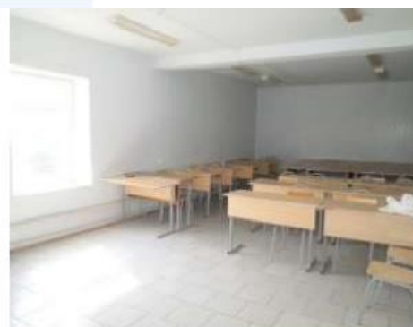
Рис. 6.14 Помещения второго этажа