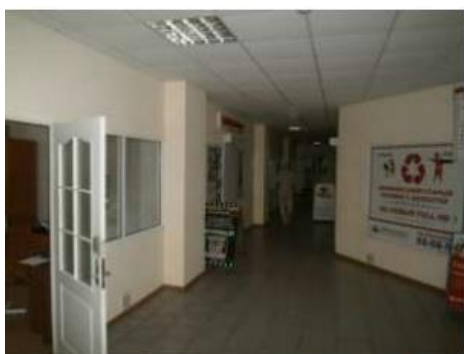
Рис. 6.11 Помещения первого этажа