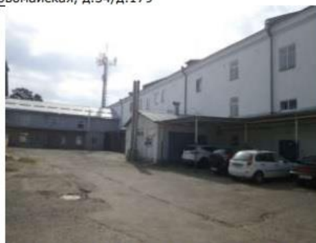
Рис. 6.10 Внешний вид объекта оценки со двора