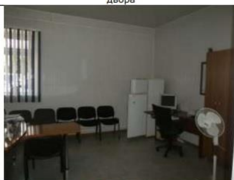
Рис. 6.12 Помещения первого этажа