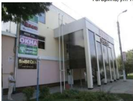
Рис. 6.9 Внешний вид объекта оценки

2. Здание табачного цеха, расположенное по адресу: Республика Адыгея, г. Майкоп, ул. Гагарина/ул. Первомайская, д.34/д.179