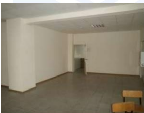
Рис. 6.13 Помещения второго этажа