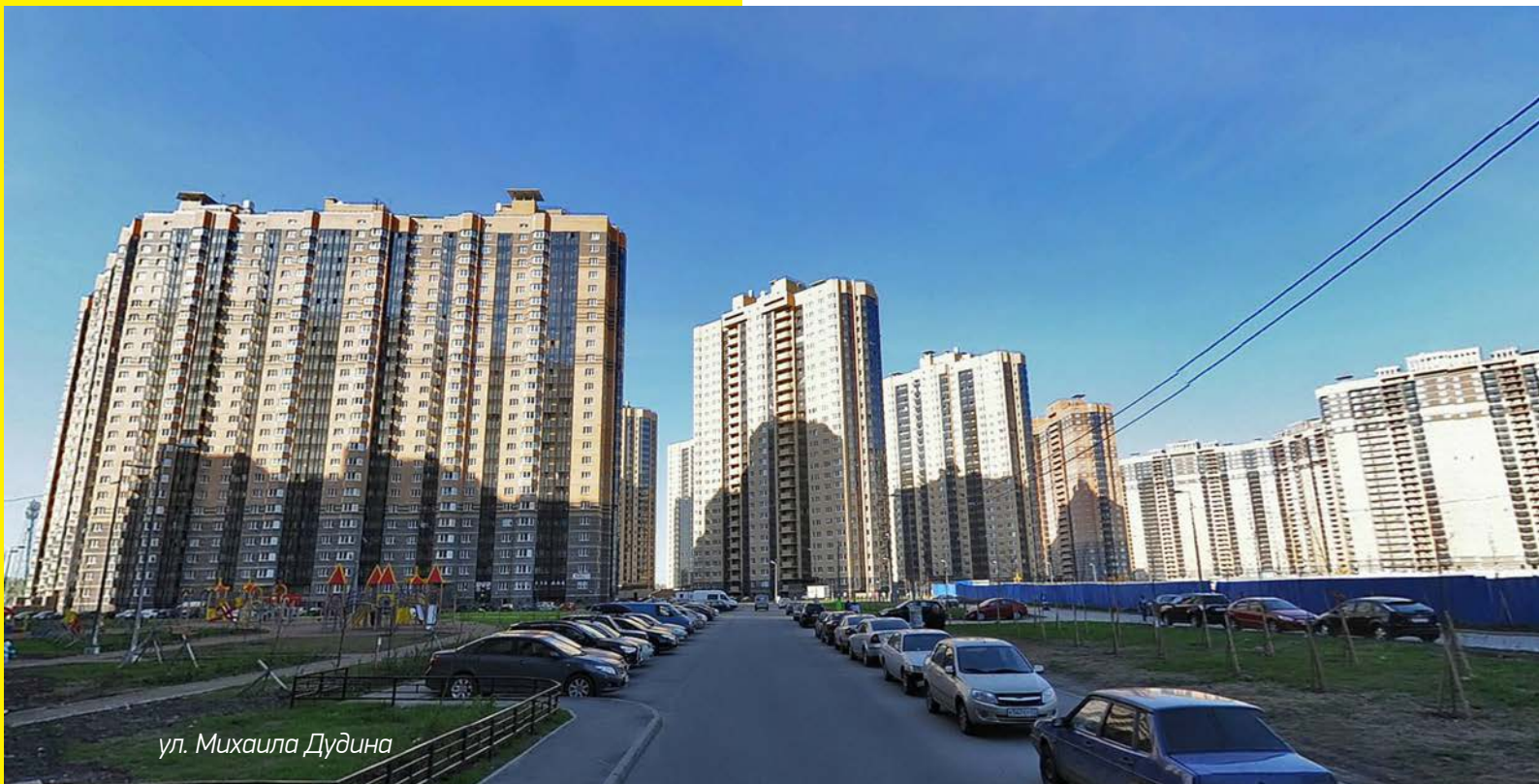
ул. Михаила Дудина